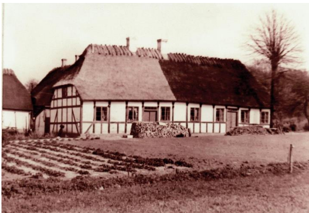
Gudbjergs første skolebygning i renoveret udgave (foto ca. 1950)