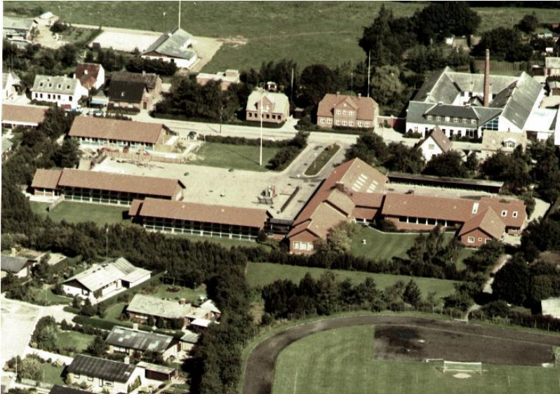
Foto fra 1980. Fhv. Gudbjerg Andelsmejeri i baggrunden.

I 1960 stod den nyopførte centralskole ved Byvej i Gudbjerg klar til brug, selv om den officielle indvielse først fandt sted året efter den 12. august. Dette medførte nedlæggelse af alle 7 eksisterende småskoler, men hvor der samtidig - med baggrund i de store afstande - indførtes en skolebusordning. Det betød transport fra yderdistrikterne for de yngste klasser året rundt, mens det kun gjaldt for de ældste klasser i vinterhalvåret.