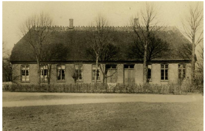
Gudbjerg hovedskole anno ca. 1900. Nu Bjarnes autoværksted.

Mullerup gods stod fadder til Gudbjerg sogns første skole tilbage i året 1718 - bekendtgjort ved følgende skrivelse: